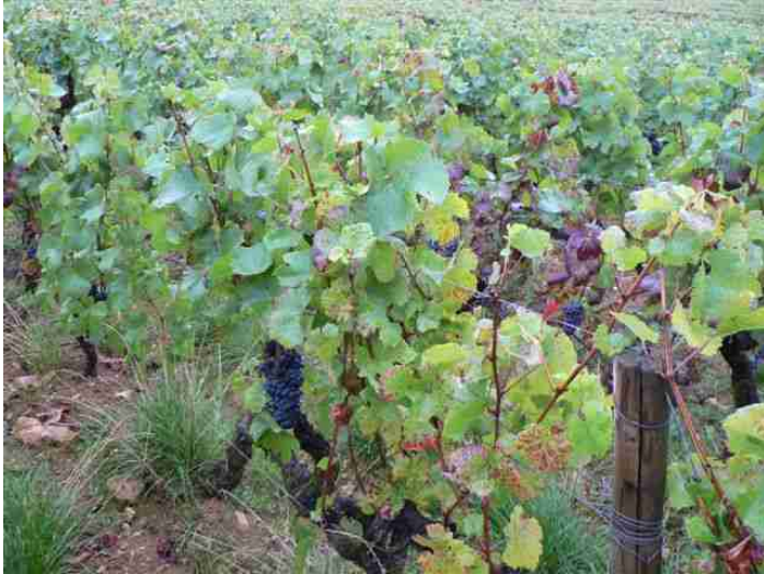
Rangs traités en conventionnel uniquement