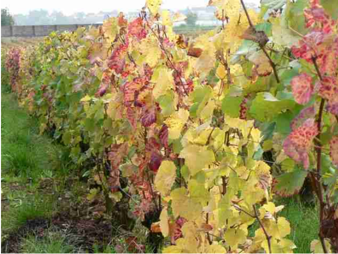
Rang traité en conventionnel uniquement